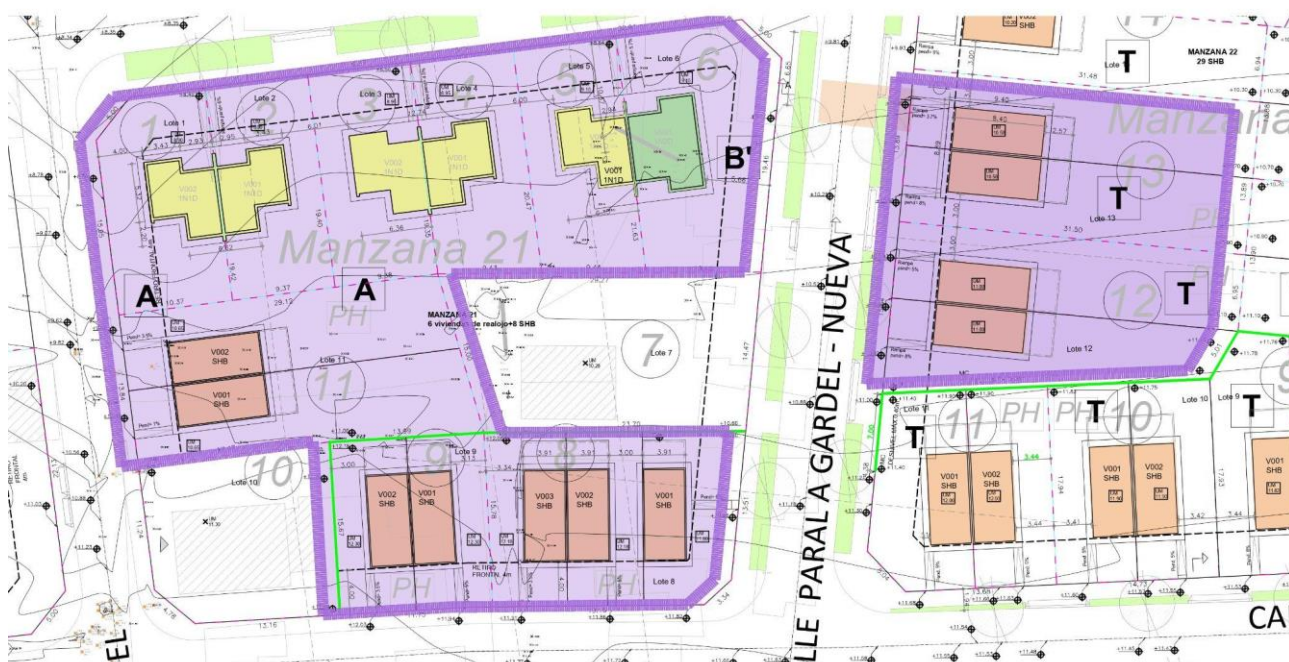
Manzanas 21 y 22.